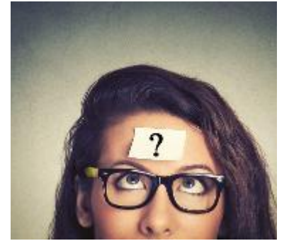
C'È ANCORA TEMPO - Per chiarirsi le idee

Possibile anche optare per un soggetto specifico