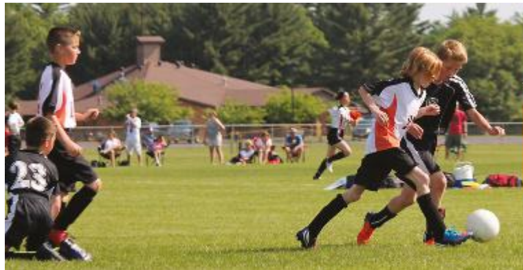
ASSOCIAZIONI SPORTIVE - Alcune possono beneficiare della quota

Chi non ne conosce i meccanismi, può essere portato a credere che sia difficile donare il 5 per mille scegliendo con successo l'ente desiderato; invece il procedimento non è complesso. Il contribuente può infatti contemplare l'opzione di versare la sua quota di 5 per mille sull'Irpef semplicemente firmando in uno dei sette appositi riquadri che figurano sui modelli della dichiarazione; oltre alla firma, si può apporre anche il codice fiscale del singolo soggetto beneficiario (tranne che nel caso di sostegno delle attività sociali