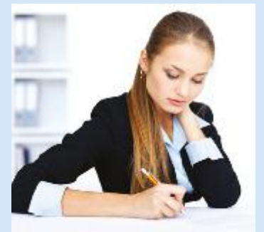
L'ENTE - Può essere specificato oppure no: basta decidere

Al momento della della dichiarazione dei redditi il contribuente ha due scelte. Può decidere se apporre unicamente la sua firma nel riquadro, senza codice; in questo caso se, ad esempio, firma nel riquadro dedicato alle ONLUS, le somme saranno ripartite in modo proporzionale in base al numero di preferenze ricevute da tutti i soggetti appartenenti alla stessa categoria. Se, al contrario, il contribuente decide di specificare l'ente, inserendo il codice fiscale nell'apposito riquadro, avrà la certezza che il suo 5 per mille verrà versato proprio a quell'ente: questa forma di donazione è diretta, a differenza dell'8 per mille, che si basa su un meccanismo proporzionale. Infine, il contribuente può decidere di